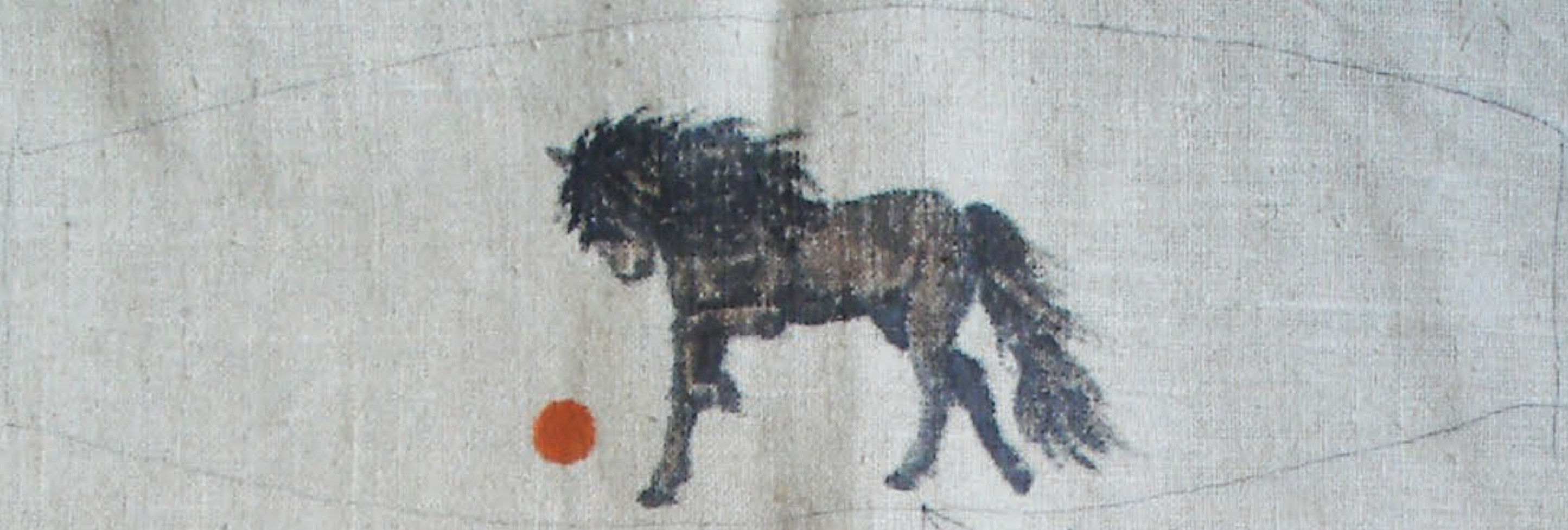
Dot (na nerke, z koniem)